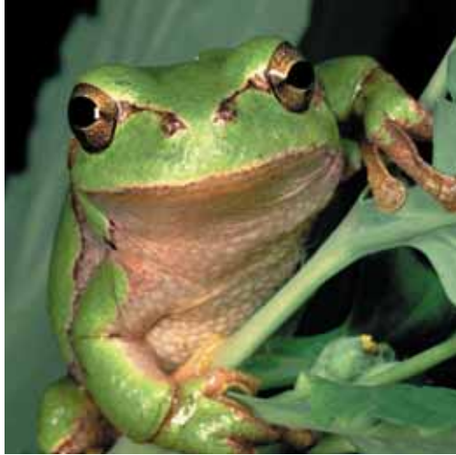
Der Laubfrosch hat in Berlin nur noch ein kleines Restvorkommen.