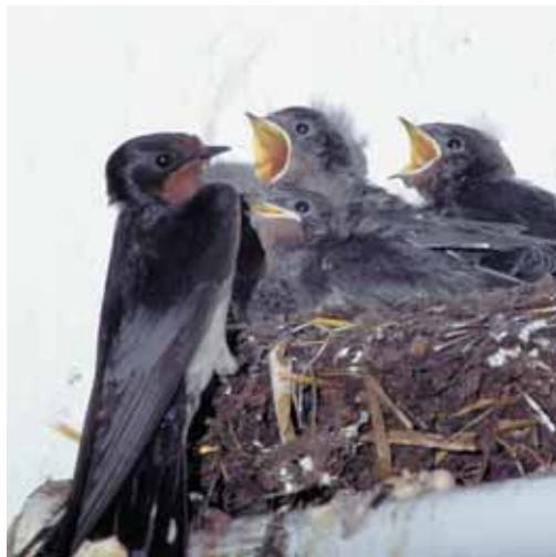
Die Schwalbeneltern - hier eine Rauchschnalbenfamilie - füttern ihren Nachwuchs mit Insekten groß.