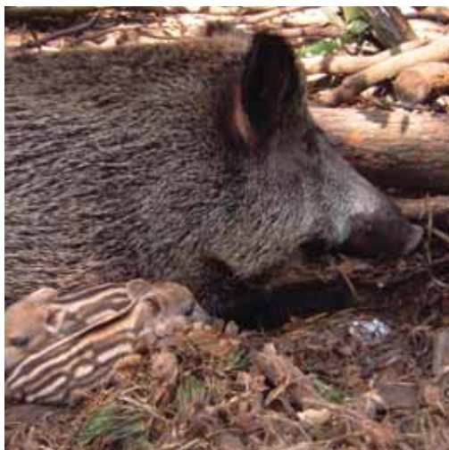
Die Wildschweinsau bei der Mittagsruhe mit ihren Frischlingen