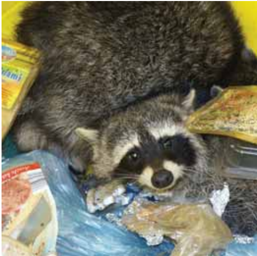
Auf frischer Tat ertappt