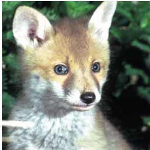
Junger Rotfuchs

Der Rotfuchs ( Vulpes vulpes ) ist eine Tierart mit extrem weiter Verbreitung und der Fähigkeit, sich an die unterschiedlichsten ökologischen Nischen anzupassen und dort fortzupflanzen. In Kulturlandschaften folgt er dem Menschen sogar in die Städte – in Berlin streift er durch Gärten, Wohngebiete, lungert auf Schulhöfen herum oder durchstöbert die Mülltonnen von Fast-Food-Restaurants nach Speiseresten.