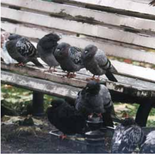
Nicht alle Straßentauben machen einen gesunden Eindruck

Seit Jahrhunderten gehören verwilderte Haustauben zum Bild europäischer Metropolen. Bei den Tieren handelt es sich um Abkömmlinge der Felsentaube ( Columba livia ), die als ursprüngliche Höhlenbrüter in den Großstädten ideale Nistbedingungen und einen durch Abfälle und wohlmeinende Tierfreunde reich gedeckten Tisch vorfinden. Aufgrund der genetischen Veränderungen durch Zucht ist die Vermehrungsrate der verwilderten Haustauben enorm hoch. Sechs bis acht Bruten im Jahr sind möglich – allerdings sterben davon rund 90 % der Jungtiere schon im ersten Lebensjahr. Zu den großen Schwärmen in den Städten gesellen sich übrigens auch immer wieder „verflogene“ Zuchttauben.