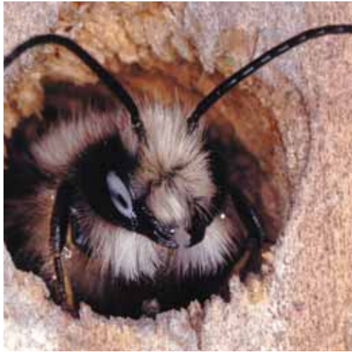
Die Rote Mauerbiene ist eine sogenannte Solitärbiene, die keine Staaten bildet.