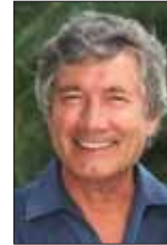
Christian Wolff Schauspieler

Manchmal ist es jedoch auch notwendig, vorbeugend zu handeln. So wie bei Duffy beispielsweise, der Ente, die auf dem Lietzensee zu Hause war, dort jedoch keine Brutstelle fand und sich deshalb einige hundert Meter weiter am Kurfürstendamm auf der Dachterrasse der Familie Krüger häuslich niederließ. Für die Krügers war die neue Nachbarschaft durchaus willkommen, zugleich aber auch ein Grund zu ernsthafter Besorgnis. Denn Duffys ungewöhnlicher Brutplatz barg eine tödliche Gefahr. Weil Entenküken Nestflüchter sind, drohte ein Absturz auf die Straße. Doch die Krügers wussten Rat. Sie holten professionelle Hilfe. Experten der Wildtierpflege kamen ins Haus und brachten Duffy samt Anhang rechtzeitig an einen sicheren Platz.