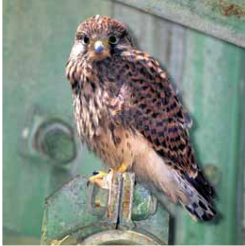
Dieser Turmfalke hat gerade sein Nest verlassen, ist aber noch nicht ganz flugtüchtig.